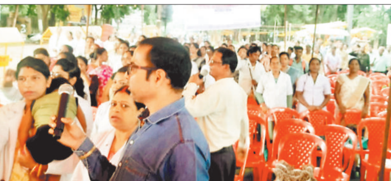
धरना स्थल पर उपस्थित एनएचएम कर्मों संघ के सदस्य।