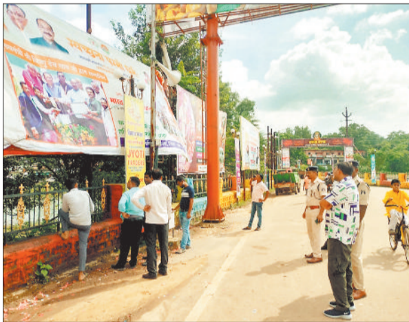
अवैध होर्डिंग्स पर कार्रवाई करती पुलिस व नगर पालिका की टीम।