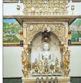
से ही पूजा-अर्चना, मंगल आरती और प्रवचन की शुरुआत हो जाएगी।

पर्व की तैयारियां जशपुर जैन मंदिर में पूरी कर ली गई हैं, मंदिर परिसर को सजाया गया है और सुबह